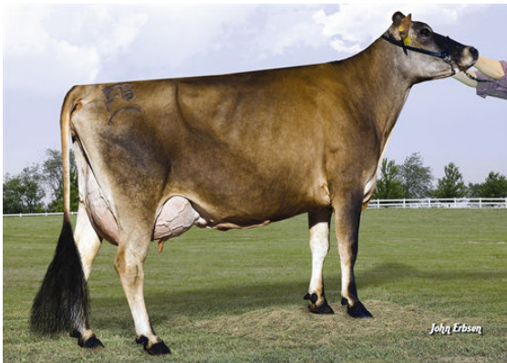
JX FARIA BROTHERS TARGET RONALDO {2} GRANDDAM