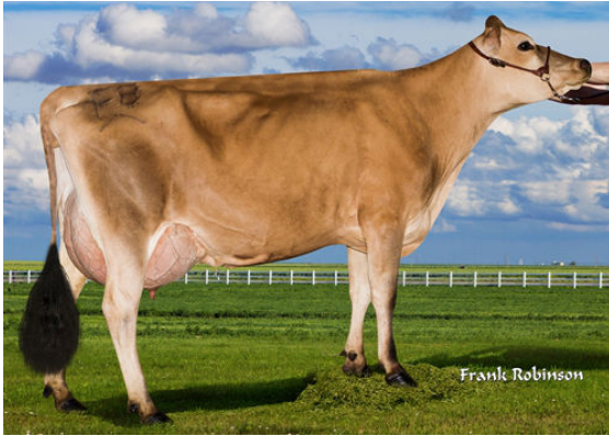
JX FARIA BROTHERS MAGNUM MILAN {3} DAM